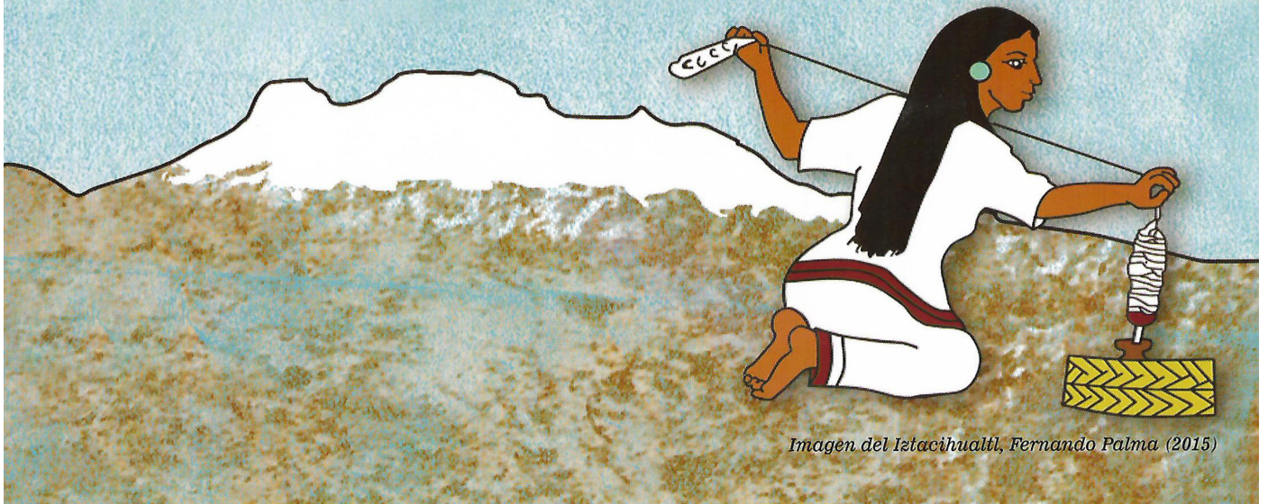
Imagen del Istacihualtl, Fernando Palma (2015)