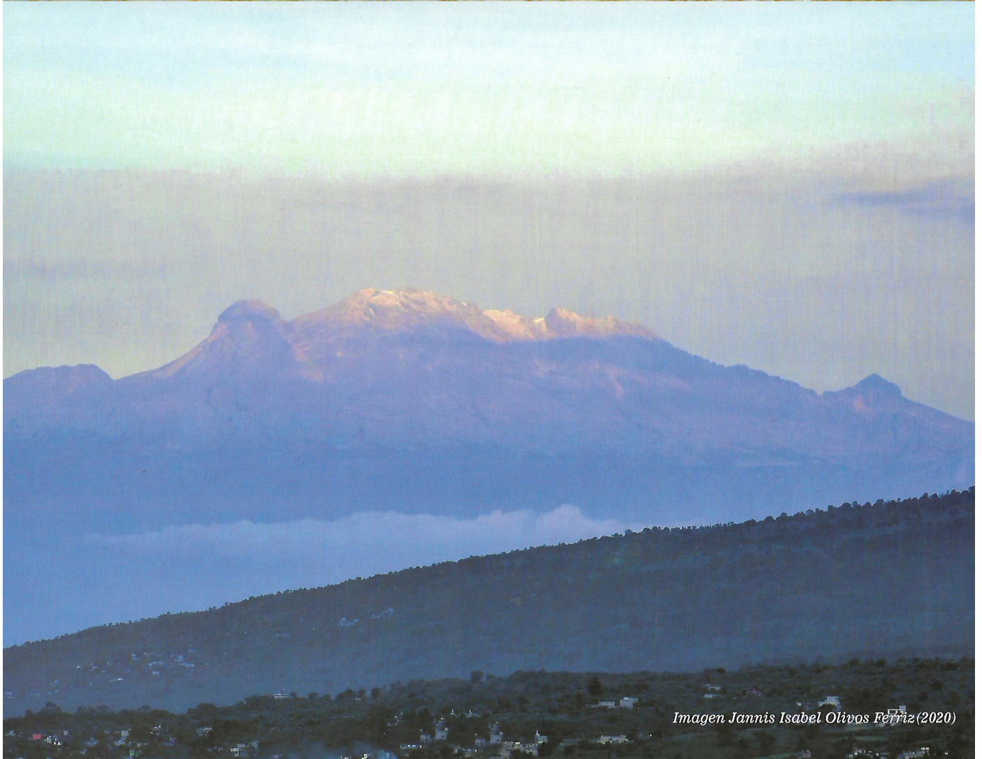
Imagen Jannis Isabel Olivos Ferriz (2020)