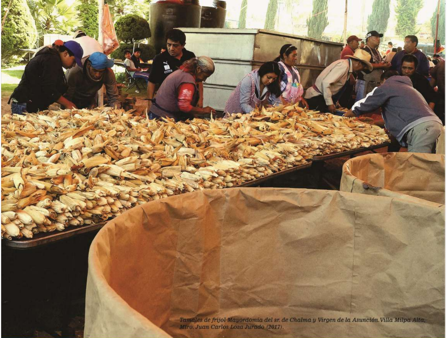
Tamales de frijol Mayordomía del sr. de Chalma y Virgen de la Asunción. Villa Milpa Alta. Mtro. Juan Carlos Loza Jurado (2017).