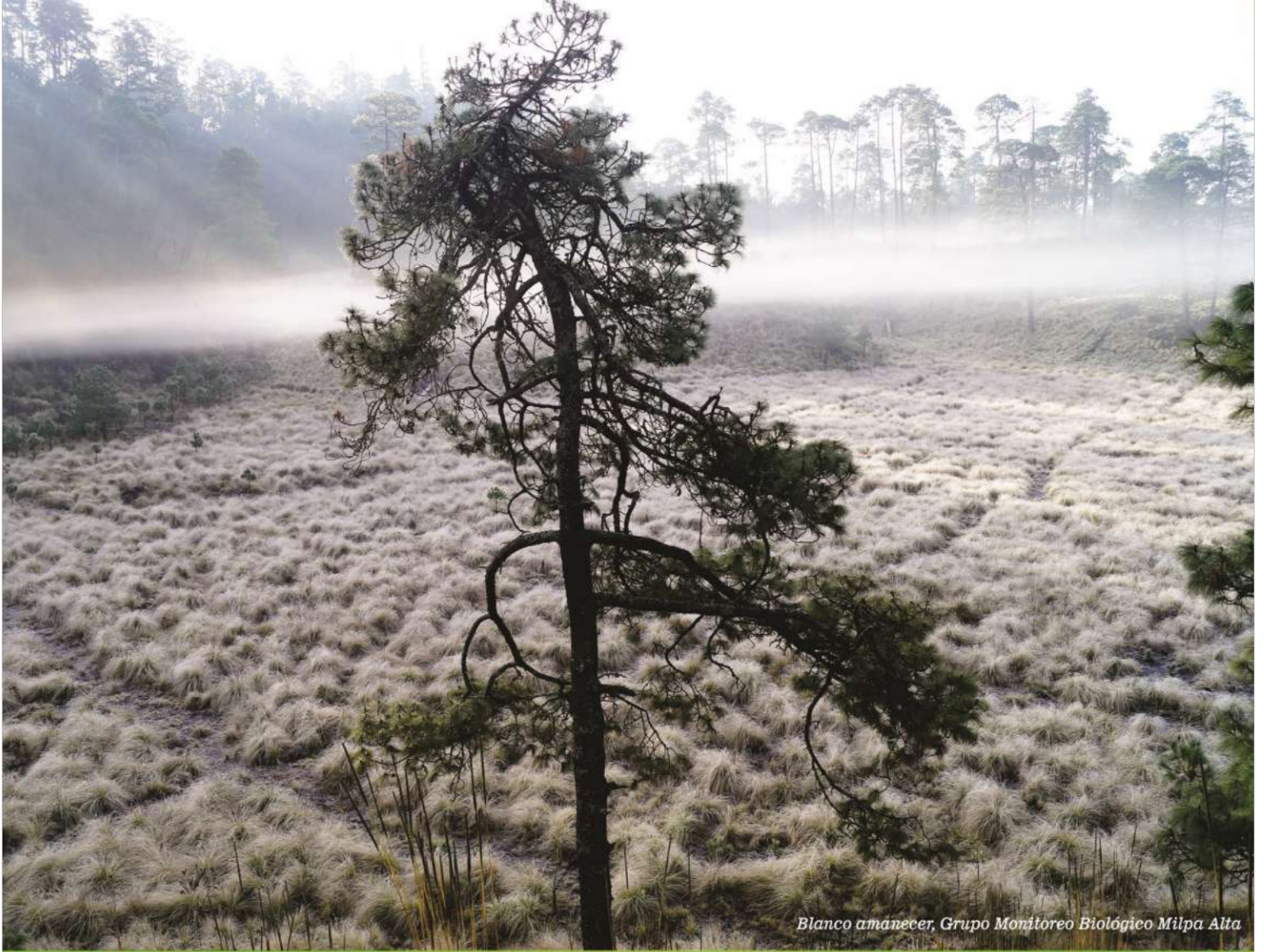
Blanco amanecer, Grupo Monitoreo Biológico Milpa Alta