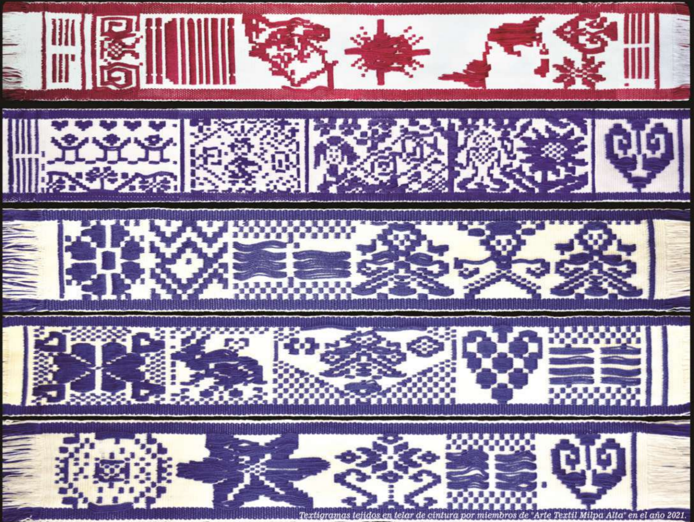
Textigramas tejidos en telar de cintura por miembros de "Arte Textil Milpa Alta" en el año 2021. Composición de imagen Flor Soledad Hernández Villegas.