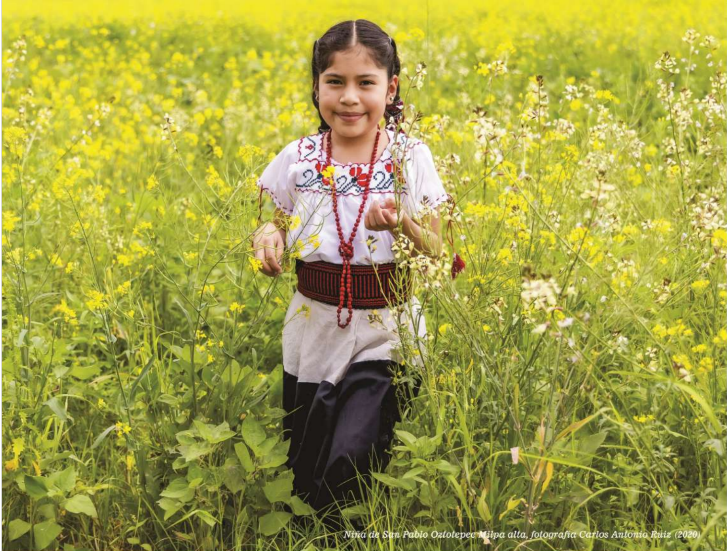
Niña de San Pablo Oztotepec Milpa alta, fotografía Carlos Antonio Ruiz (2020)