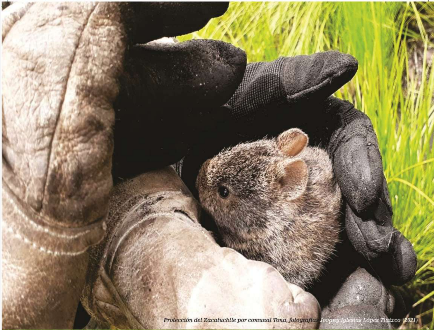
Protección del Zacatuchtle por comunal Tona, fotografías Jovany Iglesias López Tlaxco (2021)