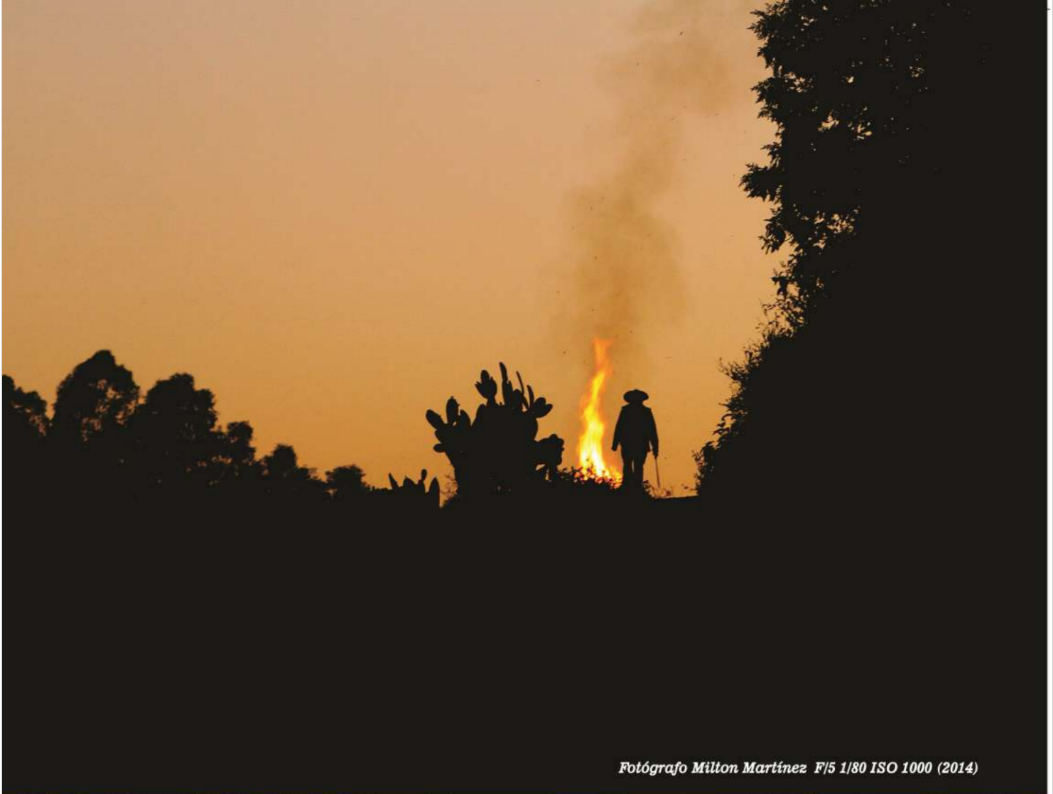
F/5 1/80 ISO 1000 (2014)