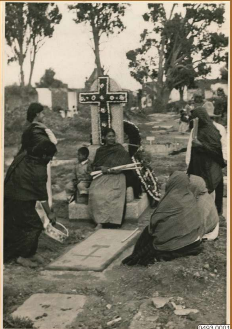
Imagen de mujeres en el panteón de Milpa Alta, 1934